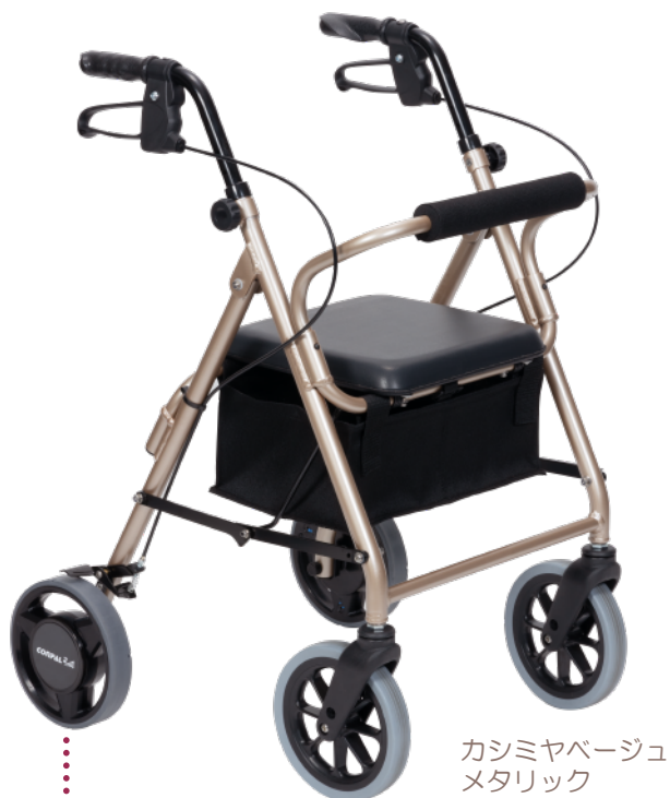
カシミアベージュ メタリック