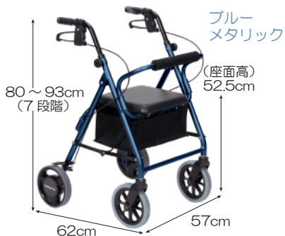
ブルー メタリック