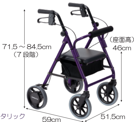
パープルメタリック