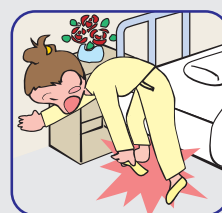
履きにくい パレーシューズ