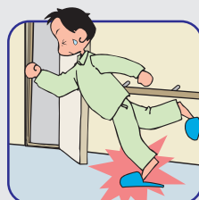
脱げやすい スリッパやサンダル