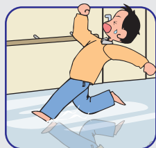
すべりやすい 素材の床