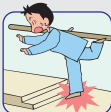
敷居など 1～2cmほどの段差