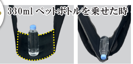
330ml ペットボトルを乗せた時 ワイド&ハード 従来品 ※当社比