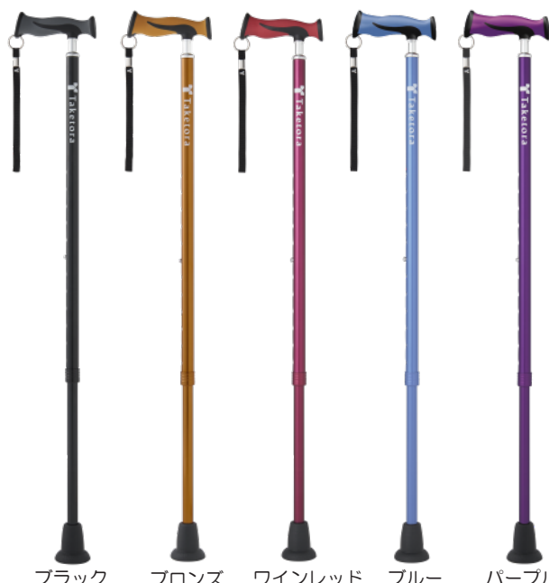
ブラック ブロンズ ワインレッド ブルー パープル