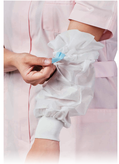
ループをつまみ引き下げると汚染面が内側になる