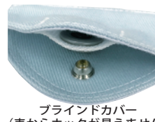
ブラインドカバー (表からホックが見えません)