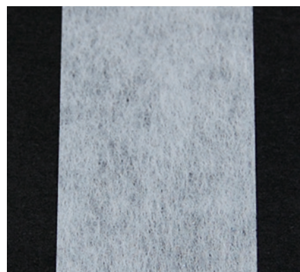
基布：パルプ不織布