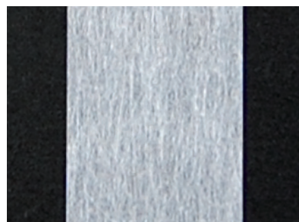
基布：パルプ不織布