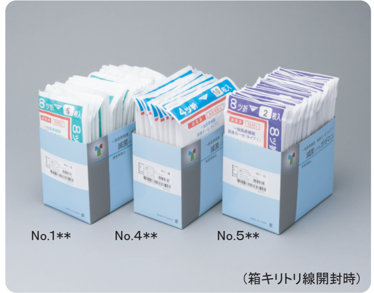
(箱キリトリ線開封時)