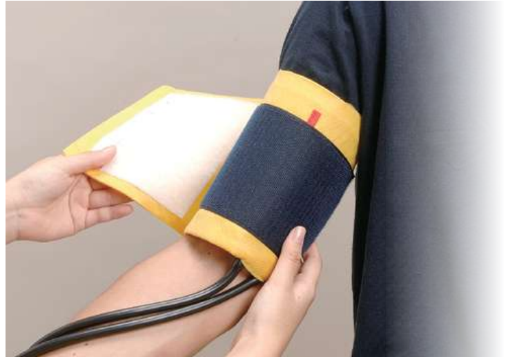
各タイプの血圧計に対応可能!