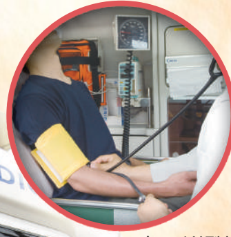
アネロイド型血圧計 (ウォールタイプ)