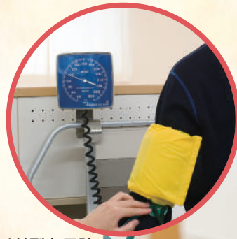
アネロイド型血圧計 (壁かけタイプ)