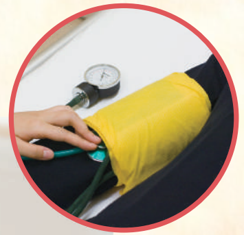
アネロイド型血圧計 (携行タイプ)