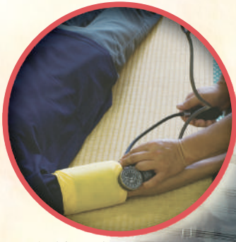
アネロイド型血圧計 (携行タイプ)